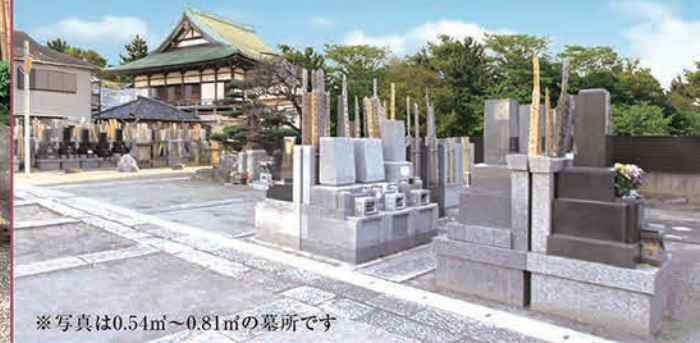
※写真は0.54㎡～0.81㎡の墓所です