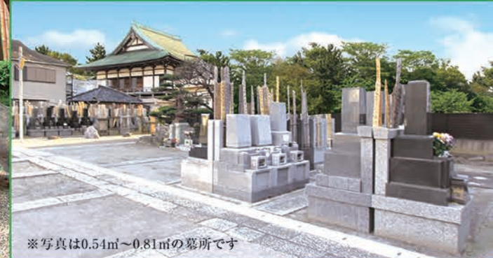
※写真は0.54㎡～0.81㎡の墓所です